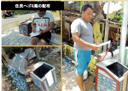
住民へゴミ箱の配布

【事業目的】シドアルジョはかつて魚やエビの粗放型養殖で自然と共生できていた地域であったが、近年急激な人口の増加により家庭汚水による水質劣化やゴミ問題などの環境問題が年々深刻になっており、多くの地元住民を支える水産養殖の将来を脅かしている。本事業は伝統的粗放型エビ養殖に従事する生産者が、当地域の水環境を守りたいとの願いから、地元主要河川の一つであるバケプ川流域の住民の環境への意識を高め、河川環境・水質改善活動を持続的に実践していくことを目的に実施する。