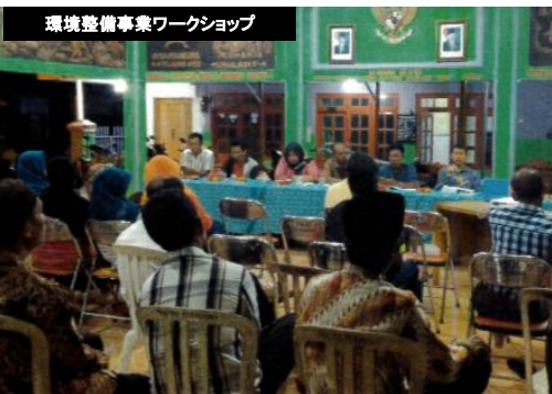
環境整備事業ワークショップ